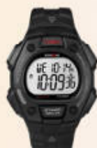
III miejsce – zegarek sportowy