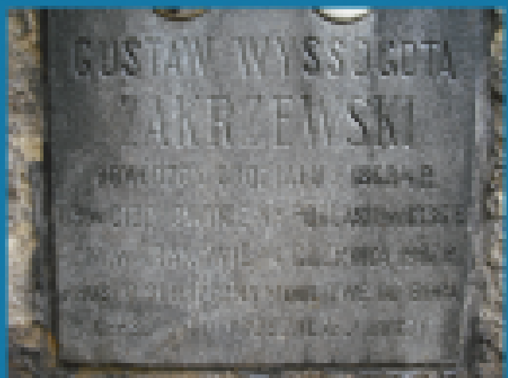
Cmentarz Rakowicki w Krakowie