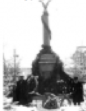
Odsłonięcie pomnika powstańców w Łukowie