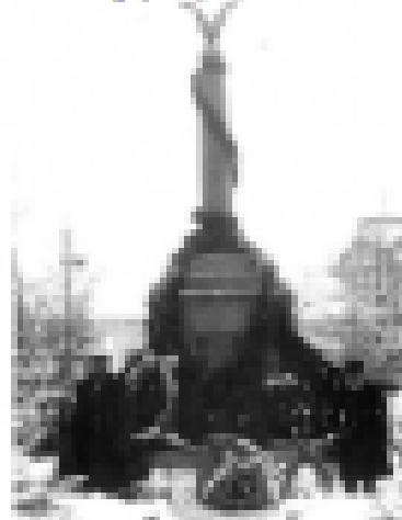
Odsłonięcie pomnika powstańców w Łukowie