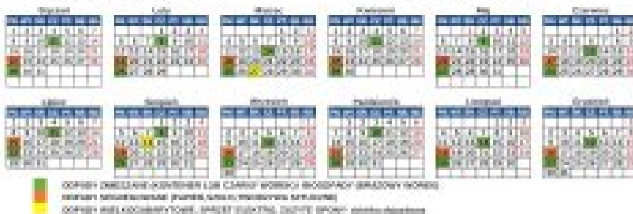
WYKONANIE ODBIORU ODPADÓW O TERENU OMIĘY WYKONANIE ODBIORU ODPADÓW

Ważne informacje: W dniu wywozu określonych odpadów wywóz pojemników przez godzinę 7:00 rano.